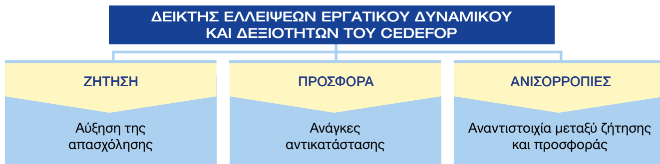
Διάγραμμα 1. Διάρθρωση του δείκτη του Cedefop σχετικά με την έλλειψη εργατικού δυναμικού και δεξιοτήτων (1)