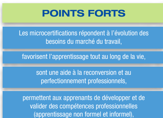
FIGURE 1. POINTS FORTS ET POINTS FAIBLES DES MICROCERTIFICATIONS

Ainsi, quelque 88 % des prestataires d'EFP ayant répondu à l'étude du Cedefop confirment qu'une partie au moins des microcertifications qu'ils proposent peut être capitalisée et combinée avec d'autres titres et certifications. Pour autant, la capitalisation de microcertifications émises en dehors du système d'enseignement et de formation formels est souvent limitée à un seul prestataire. Malgré cela, dans certains pays, comme l'Irlande, les microcertifications dites «certifications vendeurs» sont très recherchées sur le marché du travail, aussi bien pour entrer que pour progresser dans les professions du secteur des TIC. L'étude du Cedefop montre toutefois que les microcertifications doivent être homologuées par les autorités responsables de l'éducation et de la formation formelles, et satisfaire à des critères de qualité vérifiés, afin que l'utilisateur puisse les capitaliser ou les combiner en vue d'obtenir une certification complète.