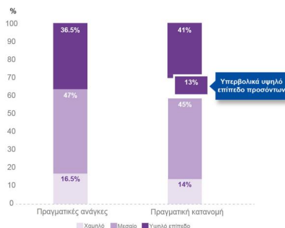
ΔΙΑΓΡΑΜΜΑ 1: ΠΡΟΒΛΕΨΕΙΣ ΤΟΥ CEDEFOP ΓΙΑ ΤΙΣ ΔΕΞΙΟΤΗΤΕΣ ΜΕ ΟΡΙΖΟΝΤΑ ΤΟ 2030: ΑΠΑΣΧΟΛΗΣΗ ΑΝΑ ΕΠΙΠΕΔΟ ΠΡΟΣΩΝΤΩΝ

Το Cedefop, επιφορτισμένο από το Συμβούλιο με την τακτική εκπόνηση προβλέψεων σχετικά με την προσφορά και ζήτηση δεξιοτήτων σε ολόκληρη την ΕΕ, παρουσίασε το 2018 –10 έτη μετά την παρουσίαση της πρώτης του πρόβλεψης– την πιο πρόσφατη επισκόπηση προοπτικών με ορίζοντα το 2030. Πρόκειται για τη μοναδική συγκρίσιμη επισκόπηση των τάσεων της αγοράς εργασίας στις διάφορες χώρες, τομείς και επαγγέλματα. Το Cedefop και το Eurofound ένωσαν τις δυνάμεις τους για να συμπληρώσουν αυτές τις προβλέψεις με πληροφορίες σχετικά με την πιθανή μεταβολή της διάρθρωσης των μισθών και των εργασιακών καθηκόντων.