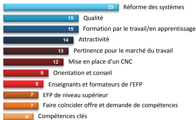
Figure 2. Priorités des réformes politiques de l'EFPP en 2010-2014 (nombre de pays)

Bien qu'ils ne soient qu'en phase initiale de mise en œuvre, les CNC sont de plus en plus utilisés comme références pour réviser les certifications ou en développer de nouvelles et moderniser les curricula. Les CNC ont également soutenu le travail sur les systèmes de validation de l'apprentissage non formel et informel. En France, par exemple, la validation des acquis de l'expérience facilite depuis longtemps l'accès à l'EFPP de niveau supérieur. Pour autant, rares sont les pays qui se sont dotés de stratégies globales de validation de l'apprentissage non formel et