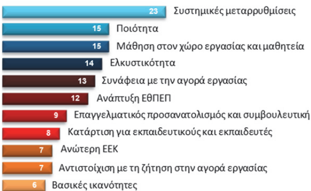
Εικόνα 2. Θέματα στα οποία επικεντρώθηκε η μεταρρύθμιση της πολιτικής στον τομέα της επαγγελματικής κατάρτισης κατά την περίοδο 2010-2014 (αριθμός χωρών)

Το υψηλό ποσοστό ανεργίας στους νέους σημαίνει ότι δεν δόθηκε η δέουσα έμφαση στη μάθηση και στην κινητικότητα των ενηλίκων. Ωστόσο, στο πλαίσιο της κατάρτισης προγραμμάτων μαθητείας, η Ισπανία σύναψε διμερείς συμφωνίες με τη Γερμανία, την Πορτογαλία και το Ηνωμένο Βασίλειο για τη δημιουργία θέσεων μαθητείας στο εξωτερικό.