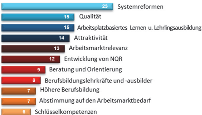
Abbildung 2. Schwerpunkte der Berufsbildungsreformen 2010 bis 2014 (Zahl der Länder)

Malta und die Slowakei haben Weiterbildungsprogramme in Modulform entwickelt, in deren Rahmen Ausbilder in der beruflichen Weiterbildung lernen können, wie sie potenzielle Ausbildungsabbrecher unterstützen können.