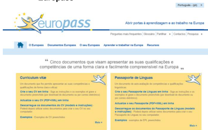
Figura 2: Nova identidade gráfica do sítio Web Europass

A facilidade de acesso tem sido, durante mais de sete anos, a chave do sucesso do Europass. Em dezembro de 2011, o sítio Web ganhou um novo grafismo, que permitiu um acesso mais rápido às informações (Figura 2). No final de 2012, será introduzido no sítio Web do Europass um novo modelo de CV. Serão também introduzidos novos serviços que melhorarão a interoperabilidade entre o Europass e outros sítios Web, que permitirão, por exemplo, guardar mais facilmente o CV Europass num portal de emprego.