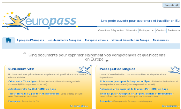
Figure 2: La nouvelle identité graphique Europass

La clé du succès d'Europass depuis 7 ans réside dans sa facilité d'accès. Depuis décembre 2011, le site bénéficie d'une nouvelle identité graphique (figure 2), qui permet un accès plus rapide aux différentes sections. Fin 2012, une nouvelle version du CV Europass sera lancée, et de nouveaux services web, qui amélioreront l'interopérabilité avec les autres sites, par exemple en facilitant le téléchargement d'un CV Europass sur un portail de l'emploi.