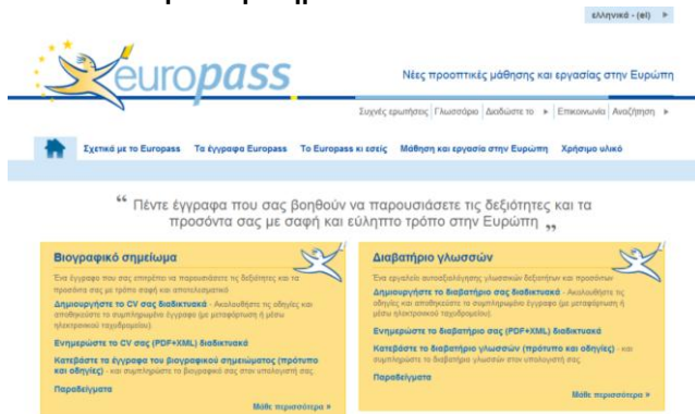
Σχ. 2: Νέα εμφάνιση του δικτυακού τόπου του Ευρωδιαβατηρίου

Εδώ και περισσότερα από επτά χρόνια, το κλειδί για την επιτυχημένη πορεία του Ευρωδιαβατηρίου είναι ότι προσφέρει εύκολη πρόσβαση στα έγγραφα. Τον Δεκέμβριο του 2011 ο δικτυακός τόπος σχεδιάστηκε εκ νέου για να παράσχει ακόμη ταχύτερη πρόσβαση (σχ. 2). Έως τα τέλη του 2012 υπολογίζεται ότι θα παρουσιαστεί κι ένα επανασχεδιασμένο βιογραφικό σημείωμα. Οι νέες διαδικτυακές υπηρεσίες θα συνδέσουν καλύτερα το Ευρωδιαβατήριο με άλλους σχετικούς δικτυακούς τόπους. Για παράδειγμα, θα γίνει ευκολότερη η αποθήκευση του βιογραφικού σημειώματος σε μια πύλη εύρεσης εργασίας.