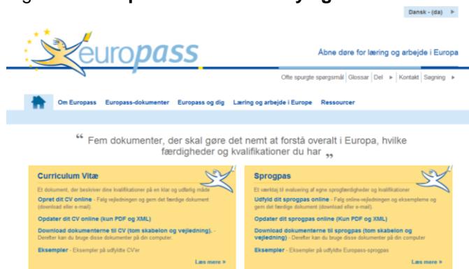
Figur 2: Europass-webstedets nye grafiske identitet

I mere end syv år har nøglen til Europass' succes været let adgang. I december 2011 fik webstedet en ny grafisk identitet med hurtigere adgang til oplysninger (figur 2). Inden udgangen af 2012 vil der på Europass-webstedet blive indført et nyt CV. Nye webtjenester vil også forbedre interoperabiliteten mellem Europass og andre websteder, f.eks. ved at gøre det lettere at gemme Europass-CV'et på en jobportal.