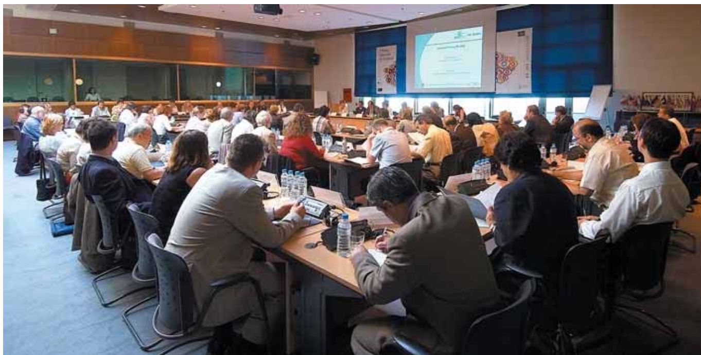
En 2007, acudieron al Cedefop más de 1.560 personas para conferencias, seminarios y talleres