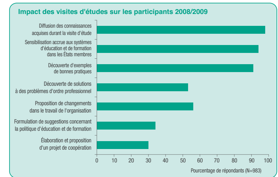
Figure 2. Synthèse des réponses

J'ai beaucoup appris sur le système d'éducation spéciale dans d'autres pays, recueilli de nombreuses idées nouvelles et développé mes compétences en anglais (participant de Hongrie).