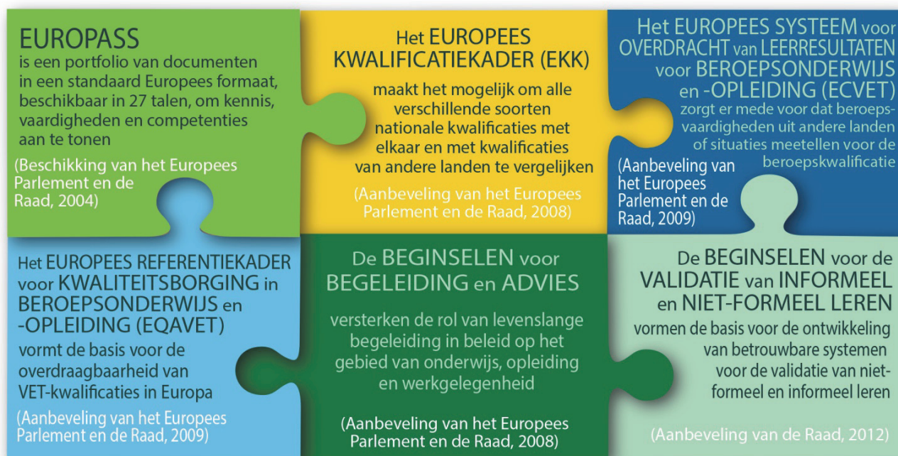
FIGUUR 1. GEMEENSCHAPPELIJKE EUROPESE INSTRUMENTEN EN BEGINSELEN

Europese samenwerking op het gebied van VET werden op de conferentie in beeld gebracht om belanghebbenden te inspireren om zich in de toekomst verder in te blijven zetten voor de modernisering van VET. In november 2015 organiseerde het agentschap in samenwerking met Eurofound (dat eveneens zijn 40e verjaardag vierde) en het Europees Economisch en Sociaal Comité (EESC) een tweede evenement in Brussel. Dit evenement herinnerde aan de centrale rol van sociale partners en het EESC bij de oprichting van beide agentschappen. Er werd ook gewezen op het belang van sociale dialoog bij het creëren van werk- en leeromgevingen die een positieve bijdrage leveren aan het ontwikkelen van skills, de productiviteit verhogen en innovatie bevorderen.