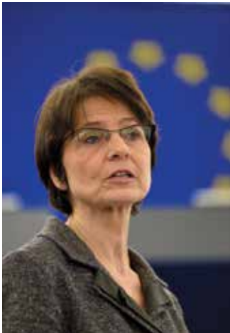
Marianne Thyssen Komisárka EÚ pre zamestnanosť, sociálne záležitosti, zručnosti a pracovnú mobilitu

„Žiadna iná organizácia než Cedefop nerozumie lepšie tomu, ako európske systémy odborného vzdelávania a prípravy vynakladajú úsilie na splnenie očakávaní 21. storočia.