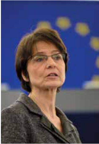
Marianne Thyssen Europees Commissaris voor Werk, Sociale Zaken, Vaardigheden en Arbeids- mobiliteit

“Cedefop begrijpt als geen ander hoe het Europese beroepsonderwijs worstelt met de eisen van de 21e eeuw.