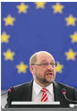
Martin Schulz Predseda Európskeho parlamentu

„Zlepšenie kapacity odborného vzdelávania a prípravy v čase veľkých ekonomických ťažkostí je nevyhnutné. Pri hľadaní riešení krízy sa musia preskúmať všetky možnosti.