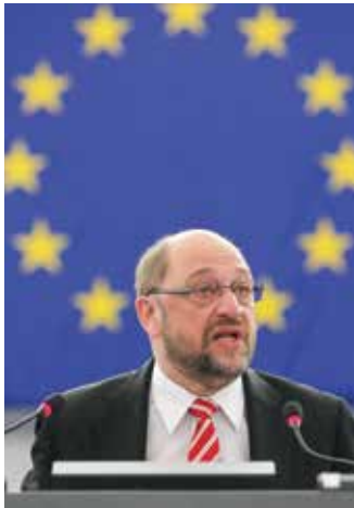
Martin Schulz President tal-Parlament Ewropew

“It-titjib tal-kapaċità tal-edukazzjoni u t-taħriġ vokazzjonali fi żmien ta’ diffikultajiet ekonomiċi kbar huwa essenzjali. Għandu jsir dak kollu possibbli fit-tfittixja ta’ soluzzjoni għall-krizi.