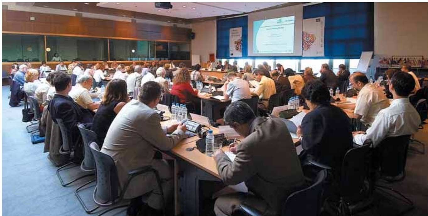
En 2007, plus de 1560 personnes sont venues au Cedefop pour assister à des conférences, séminaires ou ateliers.